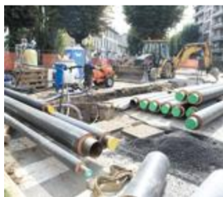
LAVORI Il cantiere di corso Mazzini