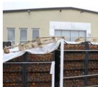
MARCIA La frutta stoccata