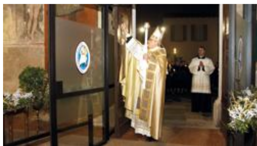
MISERICORDIA Il vescovo Malvestiti alla Porta Santa

■ Oggi, Mercoledì delle Ceneri, ha inizio per la Chiesa il tempo di Quaresima: stasera alle 21 il vescovo monsignor Malvestiti presiederà la Messa con il rito di benedizione e imposizione delle Ceneri. Proprio oggi si avvia anche il sostegno della diocesi di Lodi all'opera caritativa individuata come segno del Giubileo della Misericordia: la riqualificazione della mensa per i poveri cittadina e il successivo impegno per altri spazi in città e non solo.