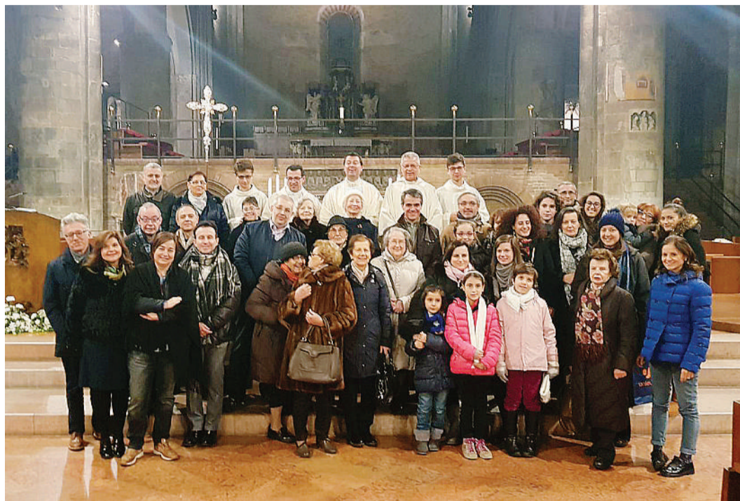
Gli aderenti dell'Ac cittadina in Cattedrale a Lodi per la celebrazione eucaristica della festa dell'adesione

A derire è una parola che va poco di moda oggi. Di questi tempi si preferisce essere indipendenti, autonomi, slegati da qualunque legame e vincolo di partecipazione. La nostra società ci spinge a vivere una vita talmente indipendente che quasi quasi ci sollecita ad ignorare gli altri, a farne a meno, come fossero inutili sovrappiù. Tant'è che molti di noi vivono in "appartamenti", ossia alla lettera, "luoghi che sono appartati dagli altri": nel giro di poche generazioni siamo passati dalla cultura dei cortili, dove tutto veniva messo in comune e condiviso, alla cultura dei condomini, in cui ciascuno vive quasi "isolato" nella propria casa e a fatica conosce i suoi vicini di pianerottolo. È evidente che in questo contesto sociale, aderire non è certo una scelta facile né scontata: tutto ci spinge nella direzione esattamente opposta: a pensare a noi stessi, a staccarci isolati, a curarci solo di quelli vicini, di quelli che sono familiari e amici. Il vocabolario della Treccani così recita al verbo "aderire": "Seguire, accettare facendo proprio, entrare a far parte di: (aderire a un'opinione; aderire al giudizio della maggioranza; aderire a un'iniziativa; aderire a un partito); e quindi anche partecipare