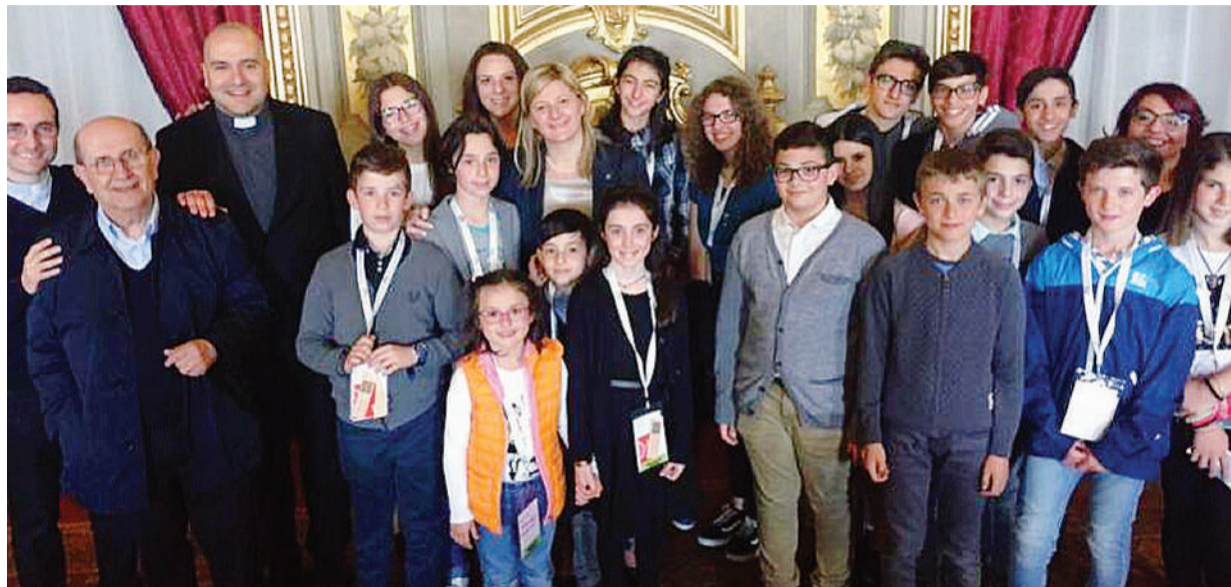
In questa pagina, l'Acr da Mattarella con il Sermig per presentare l'iniziativa “Bambini d'Italia”

La seconda proposta è il lancio anche nella nostra diocesi del progetto della Caritas Italiana “Protetto - un rifugiato a casa mia” , avvenuto in occasione della Festa dell'adesione a Casalpusterlengo, per vivere da protagonisti la cosiddetta “seconda accoglienza” .