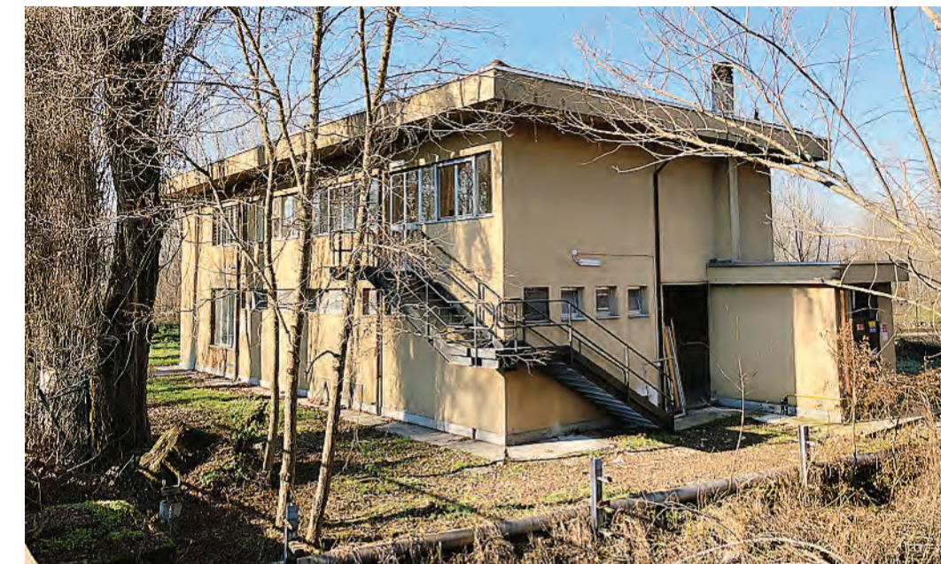
L’edificio che sta per ospitare l’Emporio della solidarietà in via Scotti a Casalpusterlengo