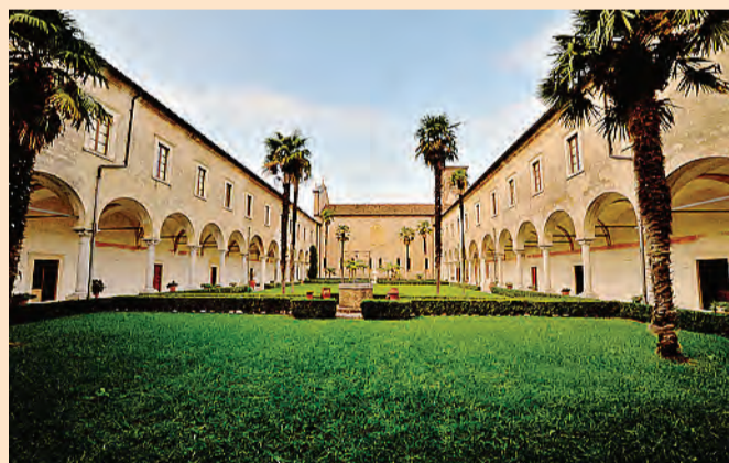
L'Abbazia di Maguzzano che ospiterà il weekend formativo

Il verbo, che caratterizza il terzo anno di questo triennio, sarà abitare, che dice portare a termine e dare stabilità a ciò che abbiamo ricevuto da una storia lunga 150 anni, custodendo come tesoro prezioso un'eredità importante e significativa per la vita di questo paese, dare stabilità a ciò che in questo triennio è stato generato come frutto di un seme che è germogliato e che ora necessita di cura e attenzione perché possa diventare una pianta e a sua volta fiorire, fare frutti e consegnare i