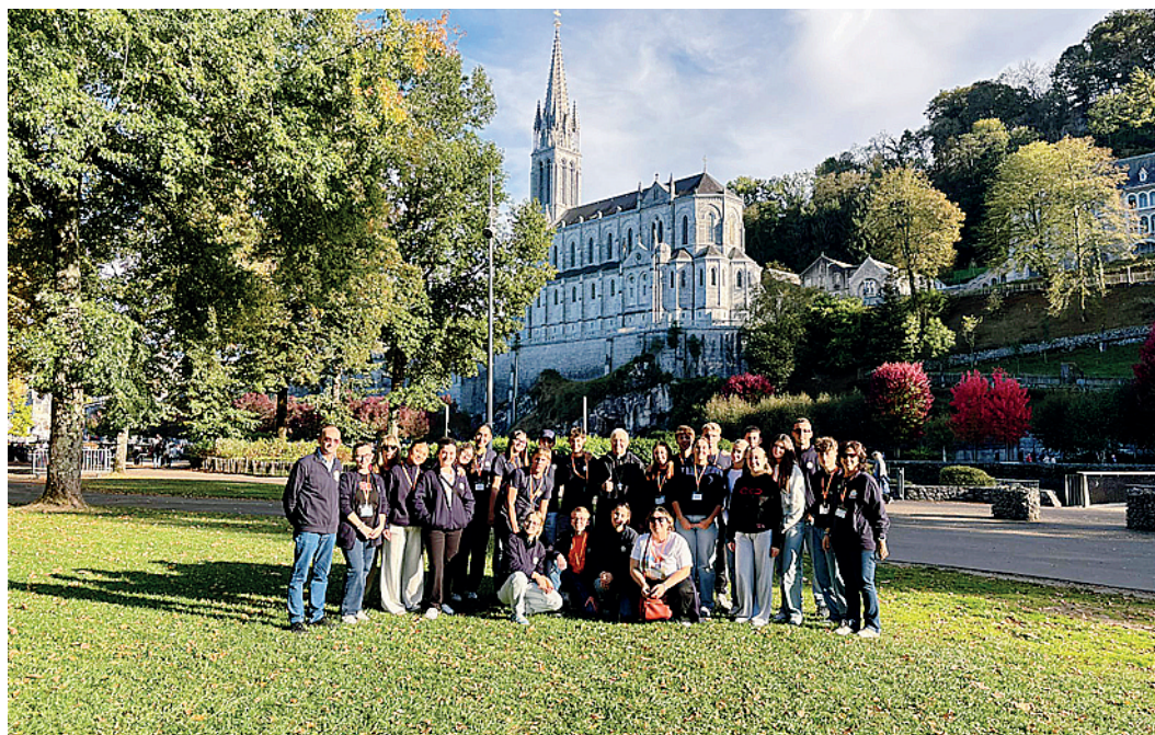
I ragazzi che hanno prestato servizio a Lourdes con l'Unitalsi con il vescovo Maurizio

N el mese di ottobre, un gruppo di studenti del Liceo "Giuseppe Novello" e dell'I.T.A.S. "Tosi", entrambe scuole di Codogno, ha partecipato al pellegrinaggio dell'Unitalsi di Lodi a Lourdes, vivendo un'esperienza intensa di servizio, condivisione e solidarietà. Una scelta libera e consapevole, nata dal desiderio di mettersi in gioco e di vivere qualcosa di profondamente umano, capace di lasciare un segno. Ogni giorno i ragazzi hanno preso parte ai turni di servizio al refettorio, preparando con cura e precisione gli spazi destinati a oltre cento persone tra anziani, ammalati e disabili. Indossando il grembiule bianco e offrendo un sorriso, hanno scoperto che servire significa molto più che svolgere un compito: è imparare a guardare l'altro con attenzione, a coglierne i bisogni, a rendersi utili con semplicità e rispetto. Il gruppo ha dato il proprio contributo anche durante i momenti comunitari del pellegrinaggio, vissuti insieme al Vescovo Maurizio, che con la sua presenza ha incoraggiato i ragazzi a vivere il servizio come occasione di incontro e responsabilità verso gli altri. L'esperienza è stata arricchita da due attività dedicate ai giovani: la visita "I